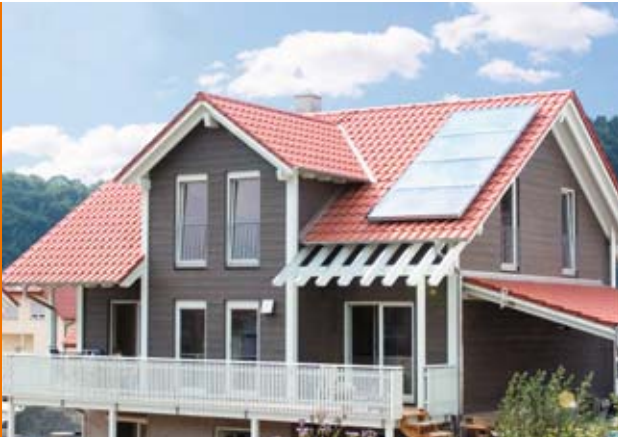
Sonnige Aussichten haben Hausbesitzer mit Pellets und Solarenergie

B eim Heizen mit erneuerbaren Energien ist die Kombination von Pelletheizung und Solaranlage besonders beliebt: Gemeinsam sorgen beide Systeme kostengünstig für eine klimaneutrale Vollversorgung.