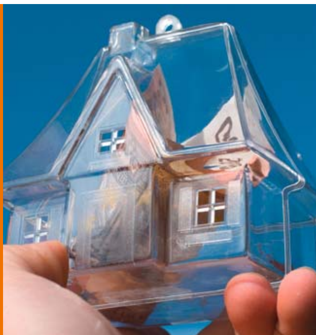
Die Kreditanstalt für Wiederaufbau stellt bis zu 50.000 Euro bereit

A uch die Kreditanstalt für Wiederaufbau (KfW) belohnt umweltbewusste Verbraucher. Das Programm Energieeffizient Sanieren sieht zinsgünstige Darlehen von bis zu 50.000 Euro pro Wohneinheit für die ökologische Sanierung von Gebäuden vor. CO 2 -sparende Investitionen wie der Einbau einer Holzpellettheizanlage können somit zu günstigen Konditionen finanziert werden. Kommunen und Unternehmen können für Anlagen ab 100 Kilowatt spezielle KfW-Darlehen beanspruchen.