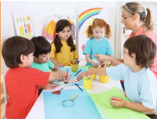
Seit 2009 profitieren umweltbewusste Kommunen von Zuschüssen

S eit 2009 unterstützt die Kreditanstalt für Wiederaufbau (KfW) auch Kommunen bei der Durchführung von Sanierungsmaßnahmen, die zur Minderung des CO 2 -Ausstoßes beitragen. Im Rahmen des Programms „Energieeffizient Sanieren – Kommunen“ können Schulen, Schulsportstätten, Kindertagesstätten sowie Gebäude der Kinder- und Jugendarbeit günstige Kredite erhalten. Voraussetzung: Die Gebäude wurden vor dem 1.1.1990 fertiggestellt und ein Fachunternehmen führt die Sanierungsmaßnahmen durch.