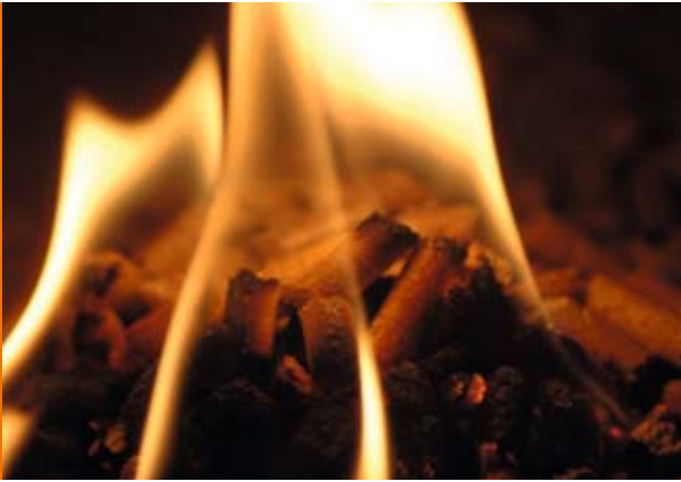
Sauber: Pellets verbrennen klimaneutral und nahezu rückstandsfrei

D eutschlandweit heizen bereits rund 125.000 Haushalte mit dem umweltfreundlichen Brennstoff Holzpellets. Dessen Beliebtheit liegt an den vielen Vorteilen der kleinen Sticks.