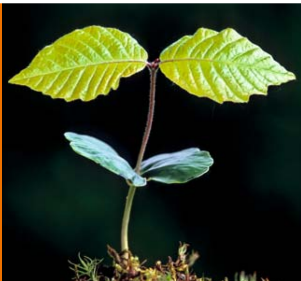
Umweltbewusst: Schon mehr als 100.000 Haushalte heizen mit Pellets