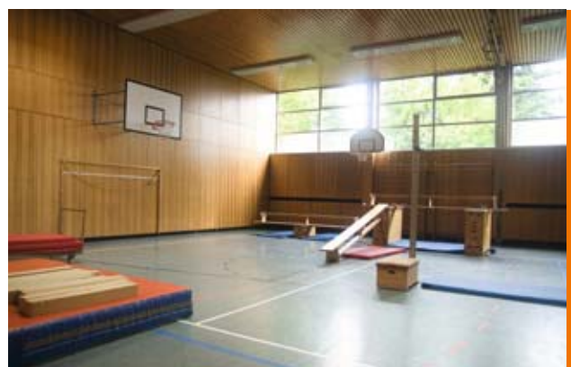
Die energetische Sanierung von Schulsportstätten lohnt sich