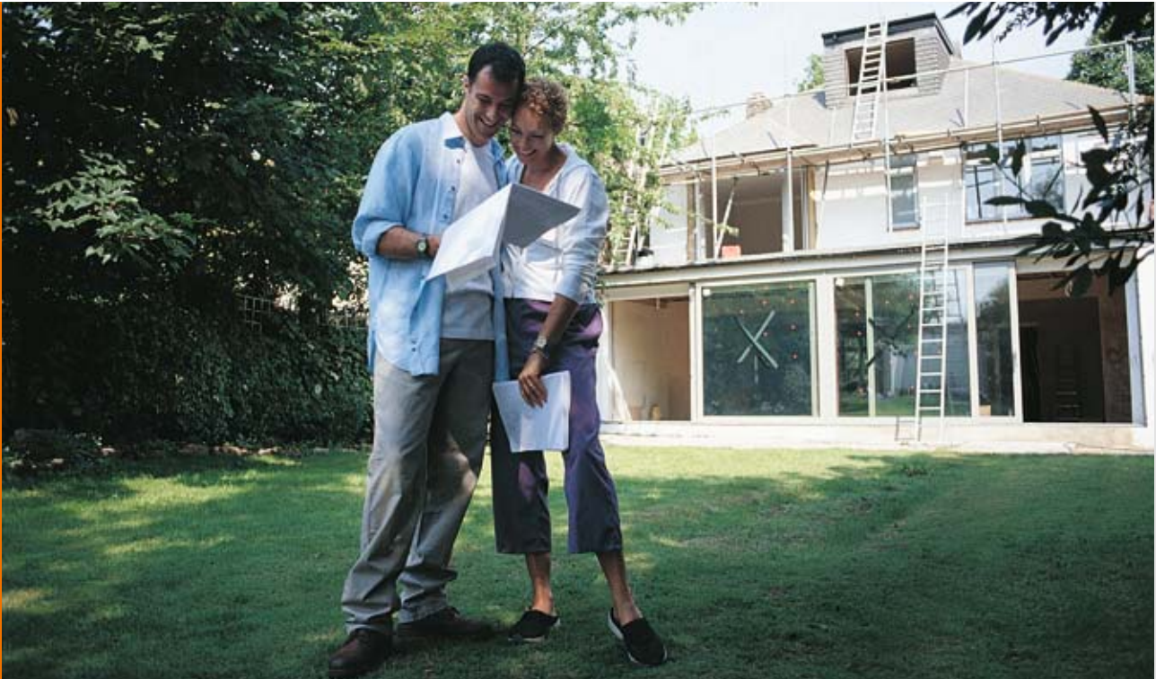
Häuslebauer profitieren: Bis zu 3.600 Euro bekommen sie aus dem Marktanzreizprogramm

A ngesichts der begrenzten Verfügbarkeit fossiler Energieressourcen und aus Umweltschutzgründen fördert die Bundesregierung den Einsatz erneuerbarer Energien im Privatbereich. Da auch Pelletöfen und -heizungen zur Erreichung der Energieeinsparungsziele beitragen und das Klima schützen, schießt der Staat im Rahmen des Marktanzreizprogramms (MAP) beim Kauf einen hohen Geldbetrag zu.