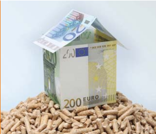
Zinsgünstige Kredite für den Einsatz erneuerbarer Energien

F ür eine zukunftsfähige und nachhaltige Energieversorgung sowie aus Umwelt- und Klimaschutzgründen fördern die KfW und das Bundesministerium für Umwelt, Naturschutz und Reaktorsicherheit (BMU) auch größere Anlagen zur Nutzung erneuerbarer Energien. Im Rahmen des Marktanreizprogramms im Programmteil „Premium“ werden Holzpellet- oder Hackschnitzelfeuerungen mit langfristigen, zinsgünstigen Darlehen der KfW sowie Tilgungszuschüssen unterstützt.